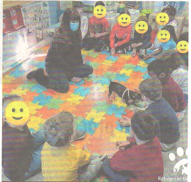
La récolte est proposée durant ce mois d'avril.

à noter www.facebook.com/groups/828483087994417?locale=fr_FR